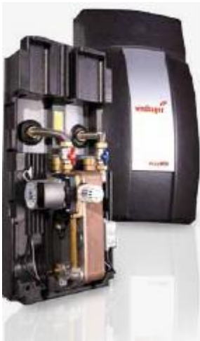
Εικόνα 3: FRIWA Μονάδα παραγωγής ZNX