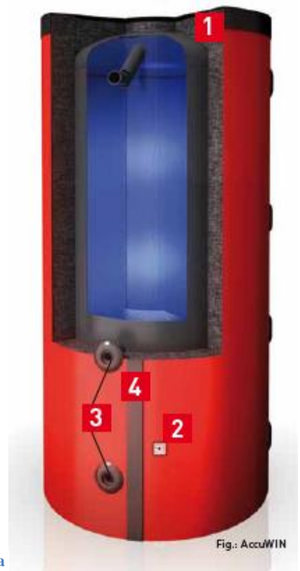
Εικόνα 2: AccuWIN

Ο παρών τιμοκατάλογος καταργεί κάθε προηγούμενο και οι τιμές μπορεί να αλλάξουν χωρίς να προηγηθεί ειδοποίηση. Ισχύει από 01/01/12