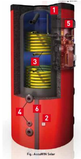
Εικόνα 4: AccuWIN Solar