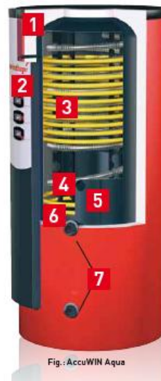
Εικόνα 1: AccuWIN Aqua